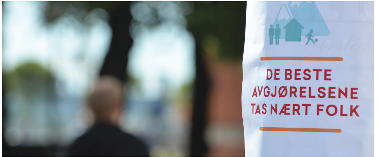
Lokaldemokrati: Kommunereforma vil auke forskjellane mellom by og land.