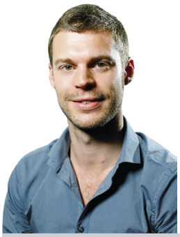
Bjørnar Moxnes b.moxnes@roedt.no Leder i Rødt