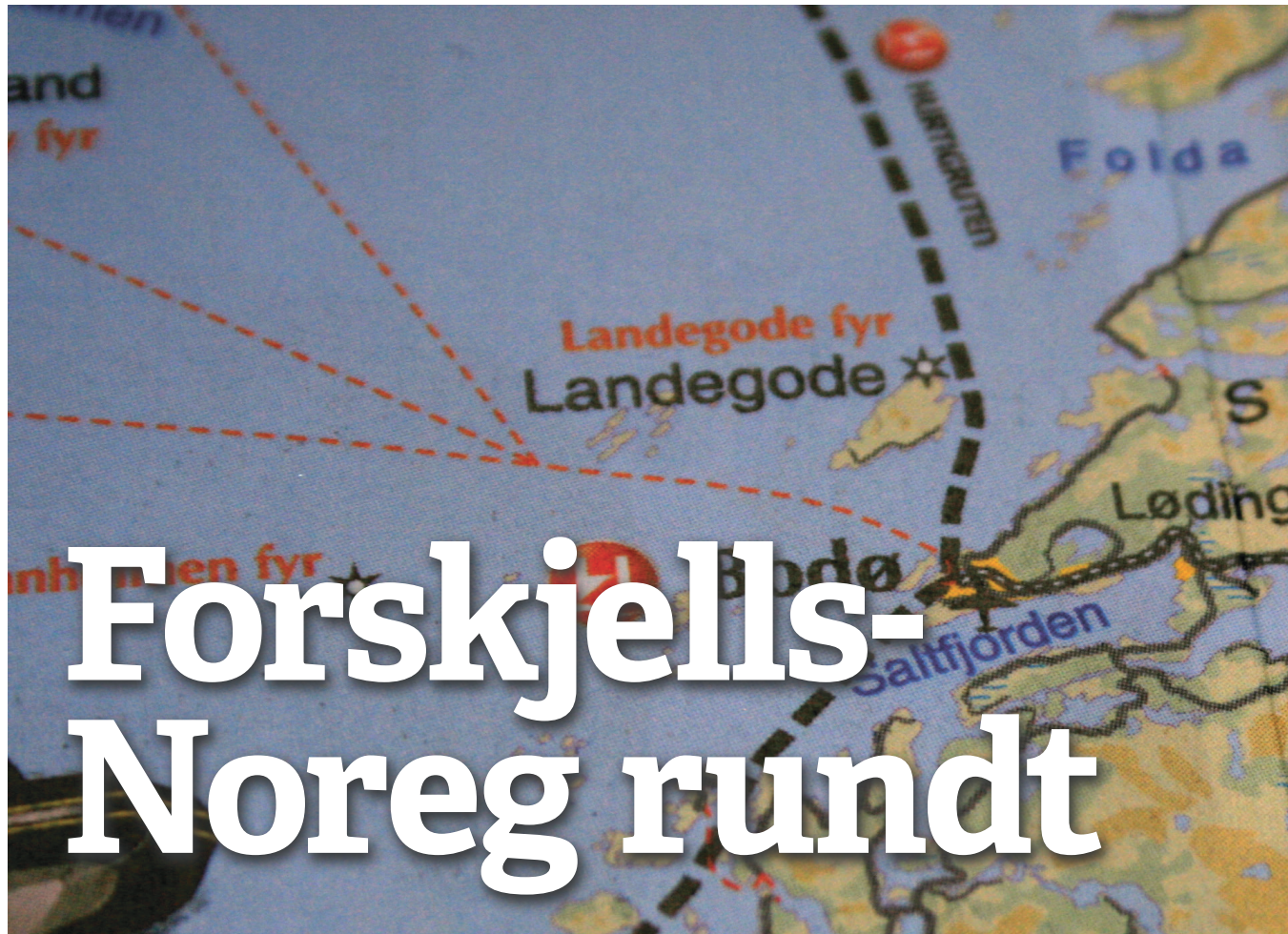
Norges-turné: Rødt-ledelsen reiser landet rundt for å drive valgkamp.

Utgiver: Rødt Dronningens gate 22 0154 Oslo