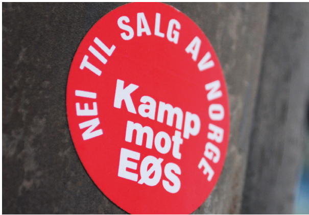
EØS-avtalen: Stadig mer upopulær.