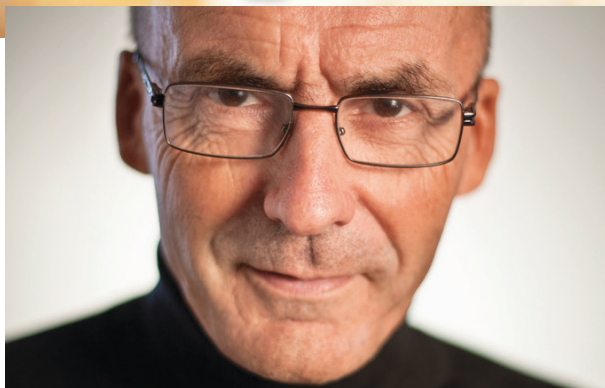
Rødt-politiker: Erling Folkvord.