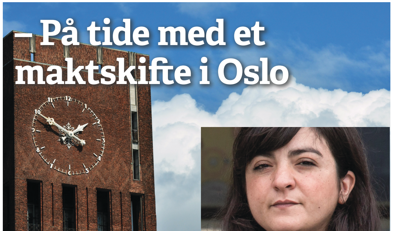
Oslo: Modent for et maktskifte.

Det politiske veivalget Norge står overfor er ikke om en vil bygge ut velferdstjenestene eller ikke. Valget står mellom om tjenestebehov skal ivaretas gjennom fellesskapsløsninger, eller om vi skal la størrelsen på egen lommebok avgjøre. Den mest alvorlige utfordringen er derfor en vedvarende underfinansiering av de norske velferdsordningene. Skal vi unngå dette krever det trolig en betydelig styrking av skattenivået over tid. Kampen mot forskjells-Norge i årene som kommer handler altså ikke bare om «Robin-Hood»-politikk, men også om hvordan og hvorfor vi skal betale for helt sentrale samfunnsområder kollektivt og solidarisk.